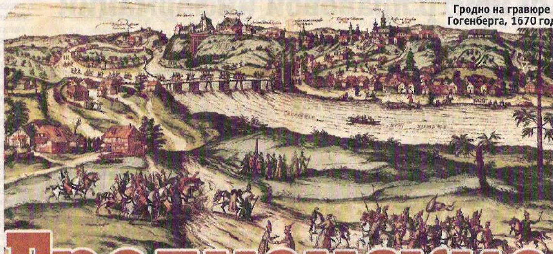
Гродно на гравюре Гогенберга, 1670 год

При короле Станиславе Августе Понятовском произошли первые изменения в планировке дворца. Руководили работами архитектор Джузеппе Сакко и декоратор Шимон Мань-