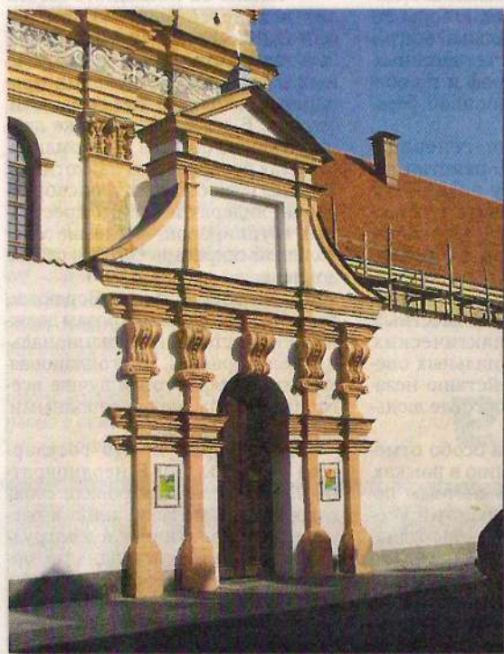
Брама Бригитского монастыря