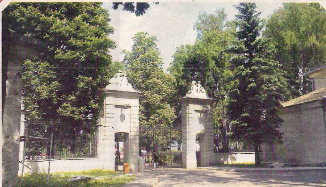
Ворота Нового замка