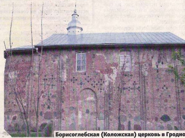
Борисоглебская (Коложская) церковь в Гродно

УЧРЕДИТЕЛЬ — МИНИСТЕРСТВО ОБОРОНЫ РЕСПУБЛИКИ БЕЛАРУСЬ