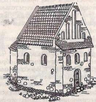
Верхняя церковь, реконструкция

Уже в 1402 году крестоносцы испытали каменный Верхний замок на прочность, и твердыня выдержала все штурмы. Для своего времени замок был исключительно мощным сооружением, в котором каменные фортификационные укрепления гармонично сочетались с рельефом местности, что