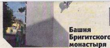
Башня Бригитского монастыря

Изображение замка, единственное в своем роде, сохранилось на гравюре